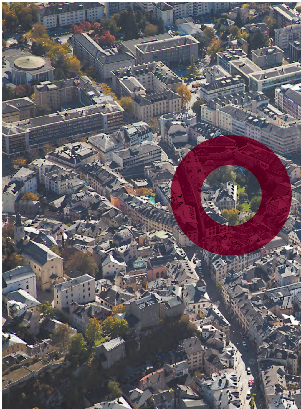
Vue aérienne de la ville, «la Préfecture» et son îlot de verdure sont bien visibles.